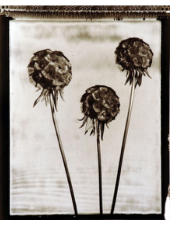
¿El Sepia es BN? ¿Tono?