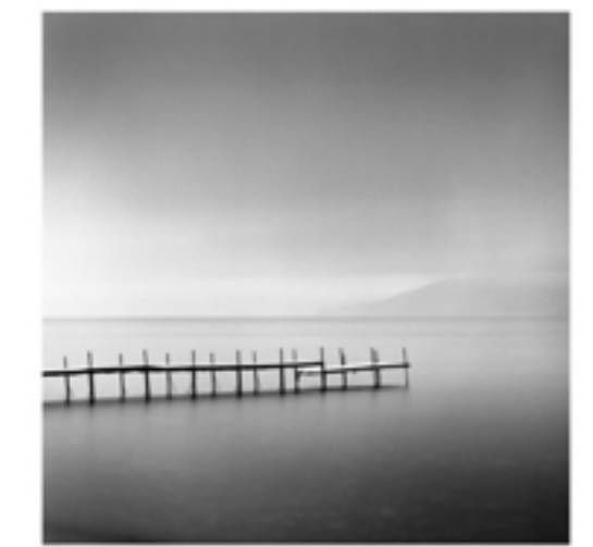
Grises (Gama Tonal)